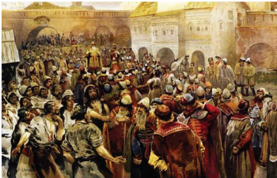
К. В. Лебедев. Вече в Новгороде. 1907 г.

В XV-XVI веках свой вклад в развитие народовластия внесло Московское княжество, где эффективно сочетались идея сильной (самодержавной) власти и идея народовластия (земского выборного самоуправления).